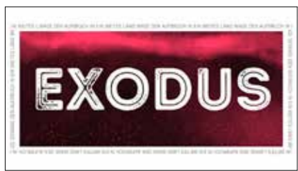
EXODUS (2. Mose 1-18)